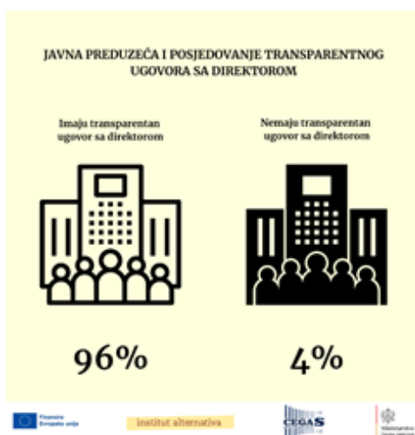
Grafikon 8: Procenat preduzeća koje imaju transparentan i dostupan ugovor sa direktorom

Svega 49% javnih preduzeća ima usvojen kolektivni ugovor, dok 51% njih ne posjeduje takav ugovor. Kolektivni ugovori su esencijalni za uspostavljanje pravičnih radnih uslova i zaštitu prava zaposlenih, kao i za regulisanje odnosa između zaposlenih i poslodavaca. Blaga većina preduzeća bez kolektivnog ugovora ukazuje na potrebu za jačanjem radnih prava i zaštite zaposlenih. Ovo takođe signalizira i slabu sindikalnu moć ili izazove u pregovaračkim procesima unutar preduzeća. Pravno gledano, nedostatak kolektivnog ugovora stavlja zaposlene u ranjiv položaj i može dovesti do neujednačenosti u primeni radnih praksi.