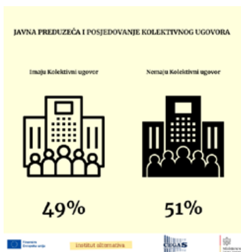
Grafikon 7: Procenat javnih preduzeća koja imaju kolektivni ugovor

Svega 49% javnih preduzeća ima usvojen kolektivni ugovor, dok 51% njih ne posjeduje takav ugovor. Kolektivni ugovori su esencijalni za uspostavljanje pravičnih radnih uslova i zaštitu prava zaposlenih, kao i za regulisanje odnosa između zaposlenih i poslodavaca. Blaga većina preduzeća bez kolektivnog ugovora ukazuje na potrebu za jačanjem radnih prava i zaštite zaposlenih. Ovo takođe signalizira i slabu sindikalnu moć ili izazove u pregovaračkim procesima unutar preduzeća. Pravno gledano, nedostatak kolektivnog ugovora stavlja zaposlene u ranjiv položaj i može dovesti do neujednačenosti u primeni radnih praksi.